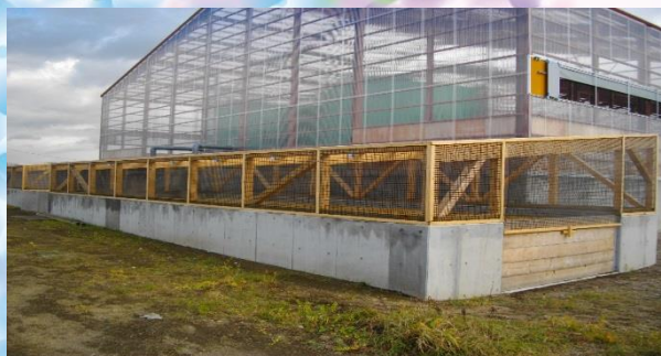
鶏糞処理施設 設置状況