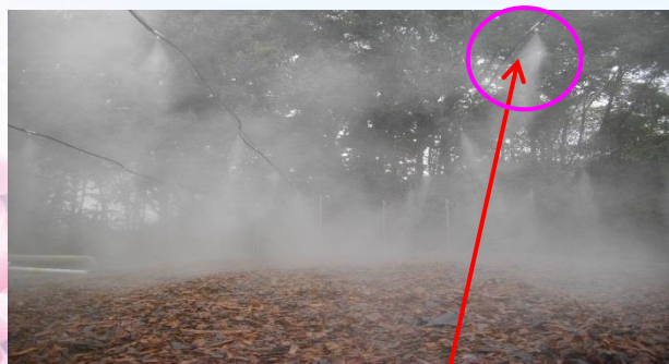
噴霧の様子 ノズル